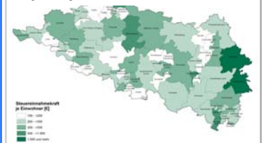
Anhang 11 – Steueraufbringungskraft in der Region Prignitz-Oberhavel

Im Februar dieses Jahres ist der neue Regionalbericht der Regionalen Planungsgemeinschaft Prignitz-Oberhavel erschienen. Der Jahresbericht informiert über die Gremienarbeit, die Beschlüsse und die Arbeitsschwerpunkte im zurückliegenden Jahr und stellt die wichtigsten räumlichen und zeitlichen Entwicklungstrends in der Region dar. Der Regionalbericht kann über die Internetpräsenz der Regionalen Planungsgemeinschaft Prignitz-Oberhavel www.rpg-po.de in der Rubrik Dokumente als kostenloser Download bezogen werden.