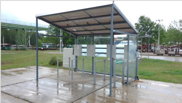
(Abbildungen Autorin, Ladestation)

(Fotos 2/4: www.igembb.wordpress.com, Einweihung der E-Tankstelle; 1/3: Abbildung Autorin, E-Fahrrad Ladebox, Ladeport für E-Autos)